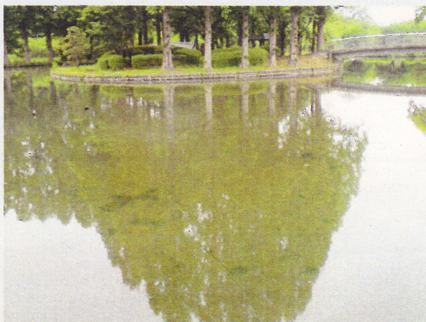
大池の池底が見えるほどの水の透明度

池の底がくっきりと見えるほどに水の透明度が上昇し、在来種の稚魚が、園路を歩いていると確認できるほどでした。また、池底からは水草が芽生えているのが確認されました。